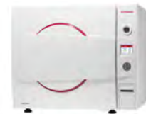
Autoclaves de sobremesa para aplicaciones de las ciencias biológicas