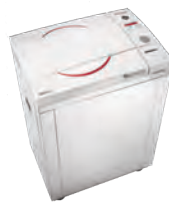
Autoclaves verticales para líquidos, cristalería y residuos biológicos peligrosos