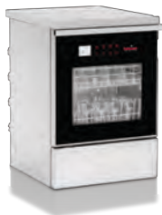
Tiva lavadora de cristalería de laboratorio

Presentamos la gama de soluciones de limpieza, desinfección y esterilización de Tuttnauer