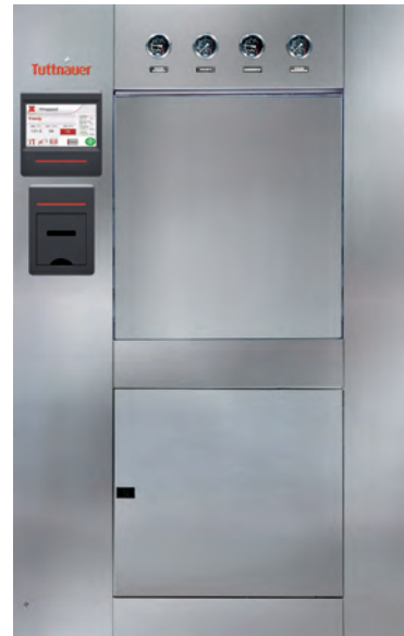
Puerta de deslizamiento vertical