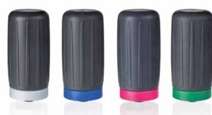
Pera de aspiración con anillo roscado, silicona