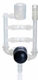
Sistema de válvulas de repuesto PP/PTFE/silicona