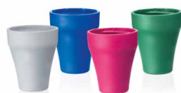
Carcasa de adaptador PP