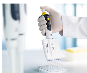
Trabajar con placas PCR