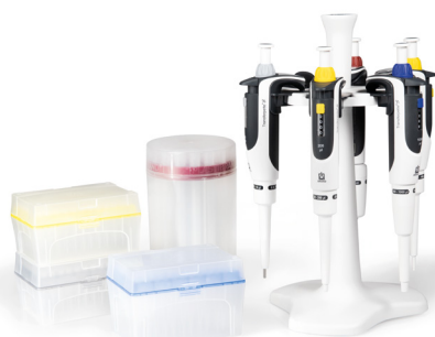
Fig. Paquete de pipetas 2