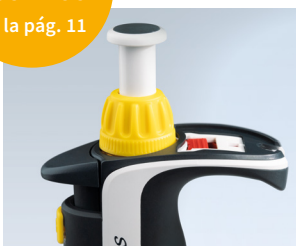
Técnica Easy Calibration