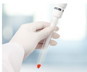
Tubos de centrifuga estrechos