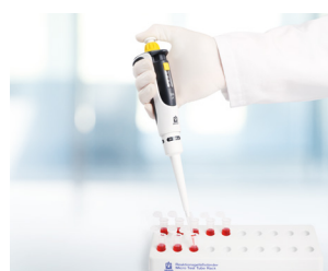
Preparación de pruebas