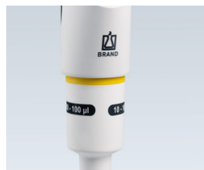
Acoplamiento del vástago integrado