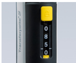
Protección contra el cambio de volumen