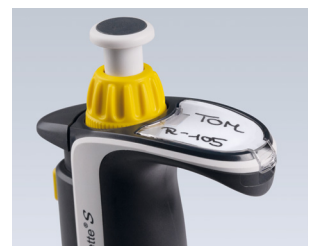
Etiqueta de escritura